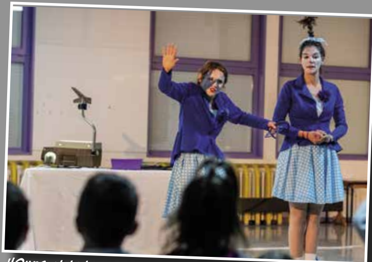
L'Ours et la Lune