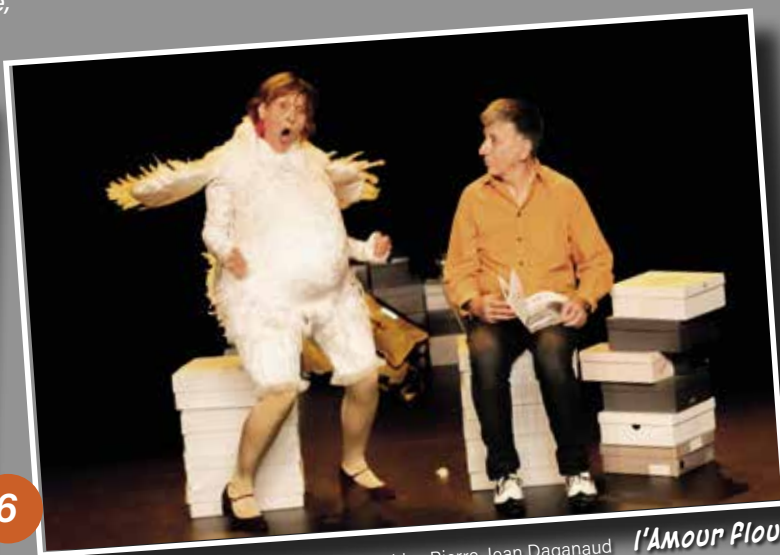
L'Amour Flou photographies Pierre-Jean Daganaut