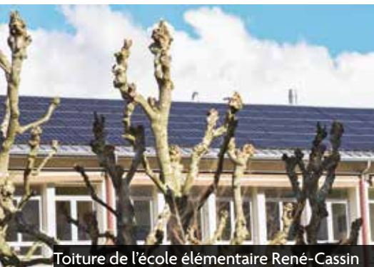
Toiture de l'école élémentaire René-Cassin

Énerg'Y Citoyennes est une SAS (Société locale par Actions Simplifiées) créée par des habitants de la Métro en 2016, dans le but de promouvoir la sortie des énergies d'origine fossile, notamment par la production d'énergies renouvelables. Ses actionnaires sont des particuliers, des