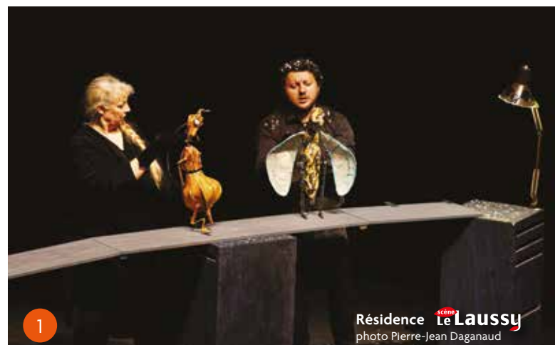
Résidence Le Laussy