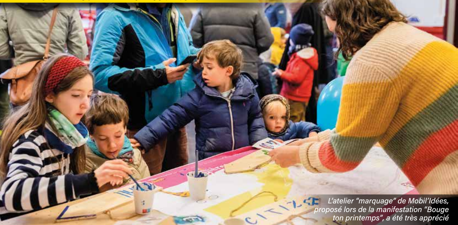
L'atelier "marquage" de Mobil'Idées, proposé lors de la manifestation "Bouge ton printemps", a été très apprécié

La démarche de concertation Mobil'Idées suit son cours et le groupe de travail se rassemble périodiquement pour lever les obstacles au développement des modes de déplacements doux à Gières. Depuis un an, un diagnostic partagé a été réalisé sur l'ensemble de la commune et a permis d'identifier les problématiques de cheminement piétons et cycles.