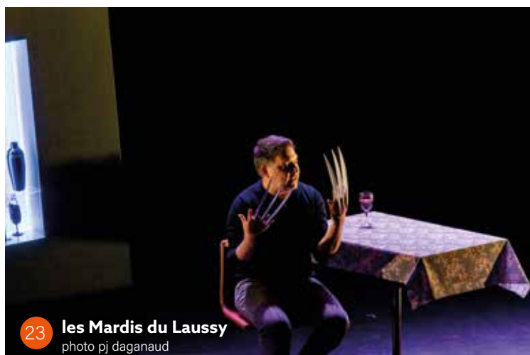
23 les Mardis du Laussy